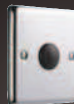
Plaque de couverture - AE003