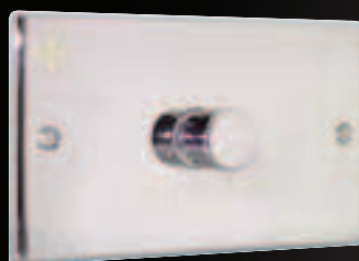
Régulateur de tension - AE002