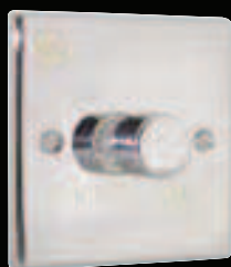
Régulateur de tension - AE001