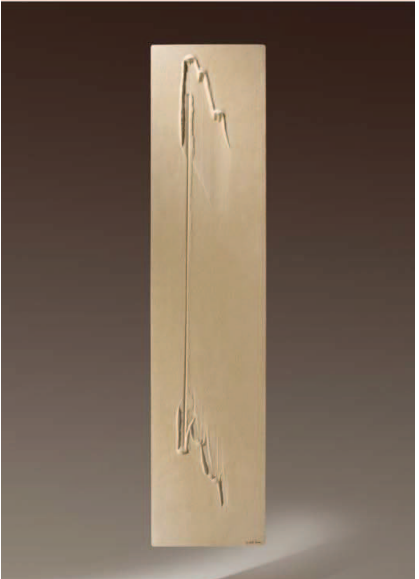
RADIATEUR EN PIERRE OLYCALE® | CHALEUR RAYONNANTE À BASSE TEMPÉRATURE Radiator in OLYCALE® stone – Radiant heat at low temperatures