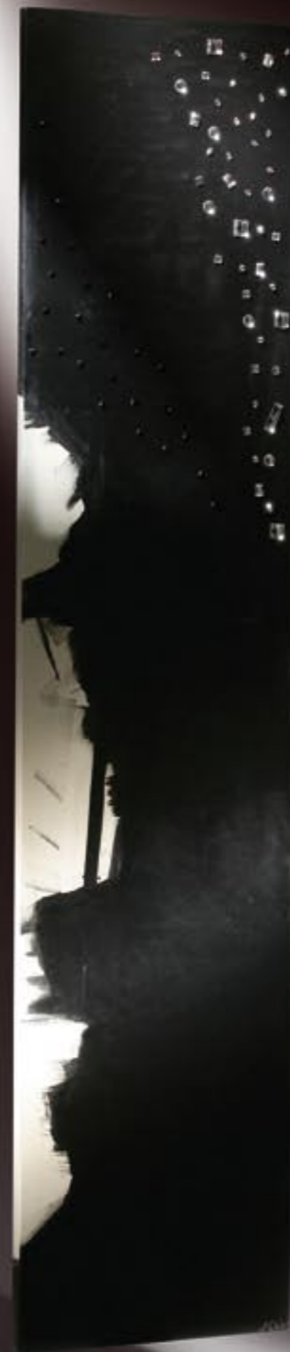
NUIT DE CRYSTAL

Orné de CRYSTAL LIZET SWAROVSKI ELEMENTS